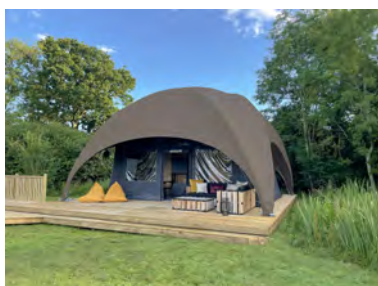
グレイッシュブラウン